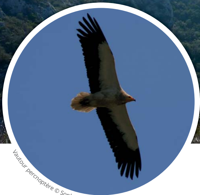
Vautour percnoptère