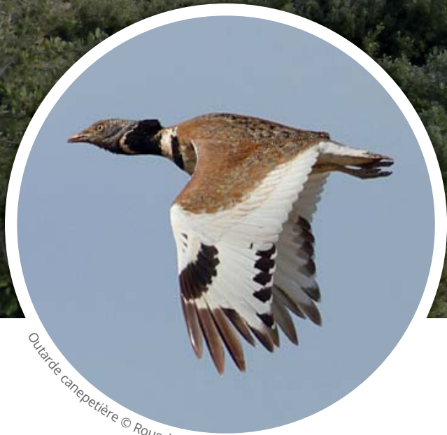
Outarde canepetière