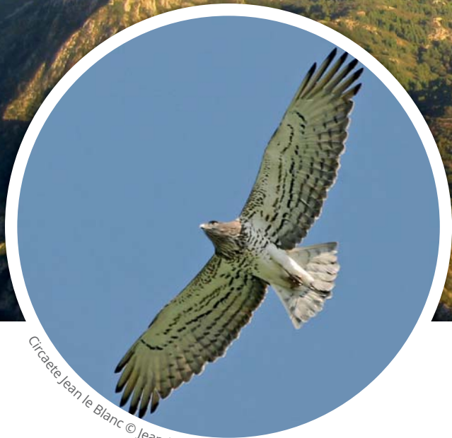
Circaète Jean le Blanc