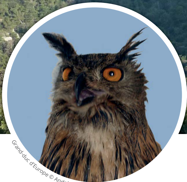
Grand-duc d'Europe