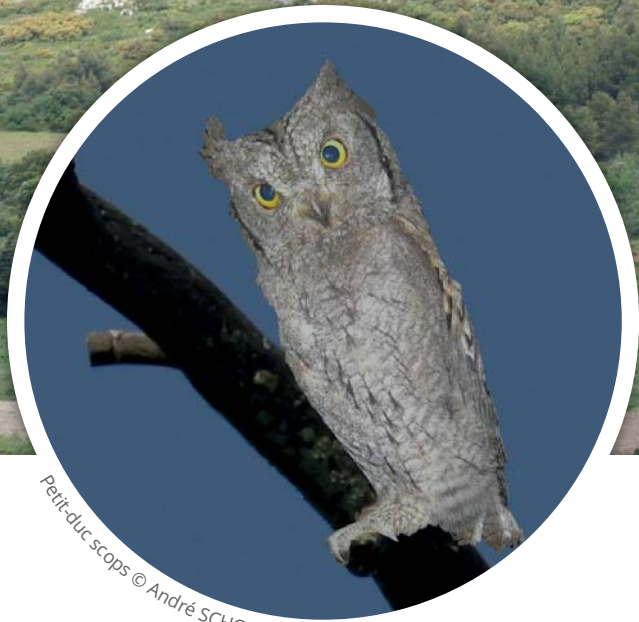
Petit-duc scops