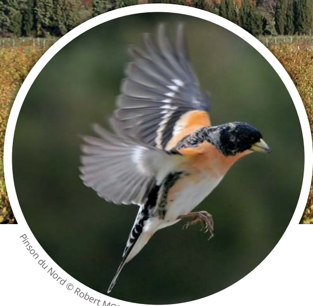
Pinson du Nord