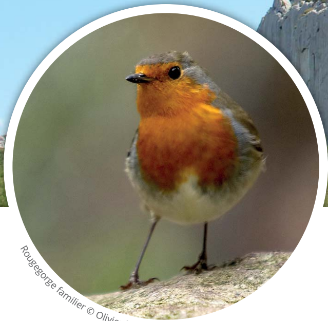
Rougegorge familier