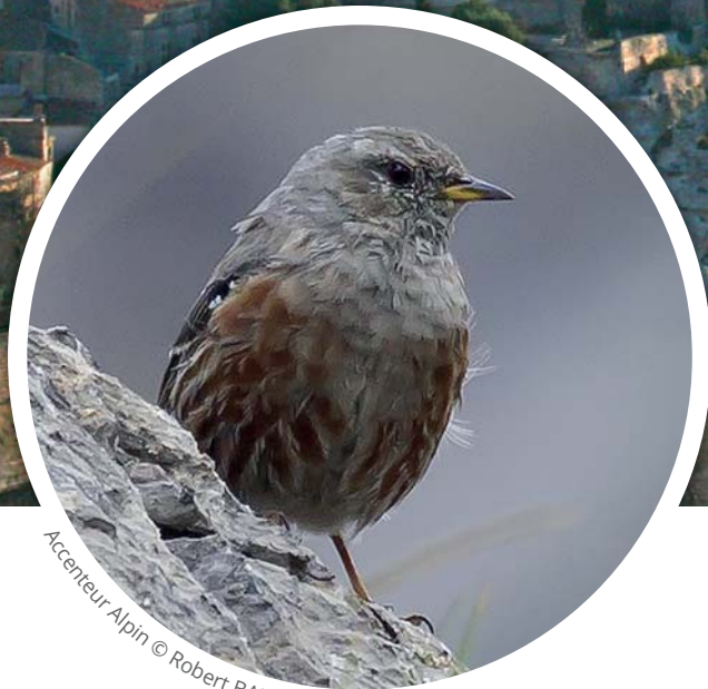
Accenteur alpin