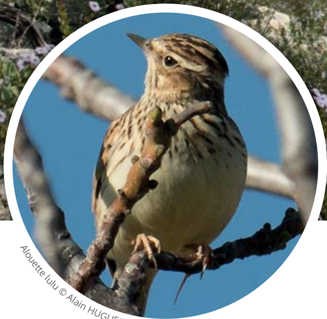
Alouette lulu