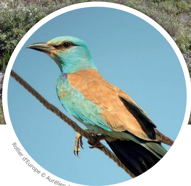
Rollier d'Europe