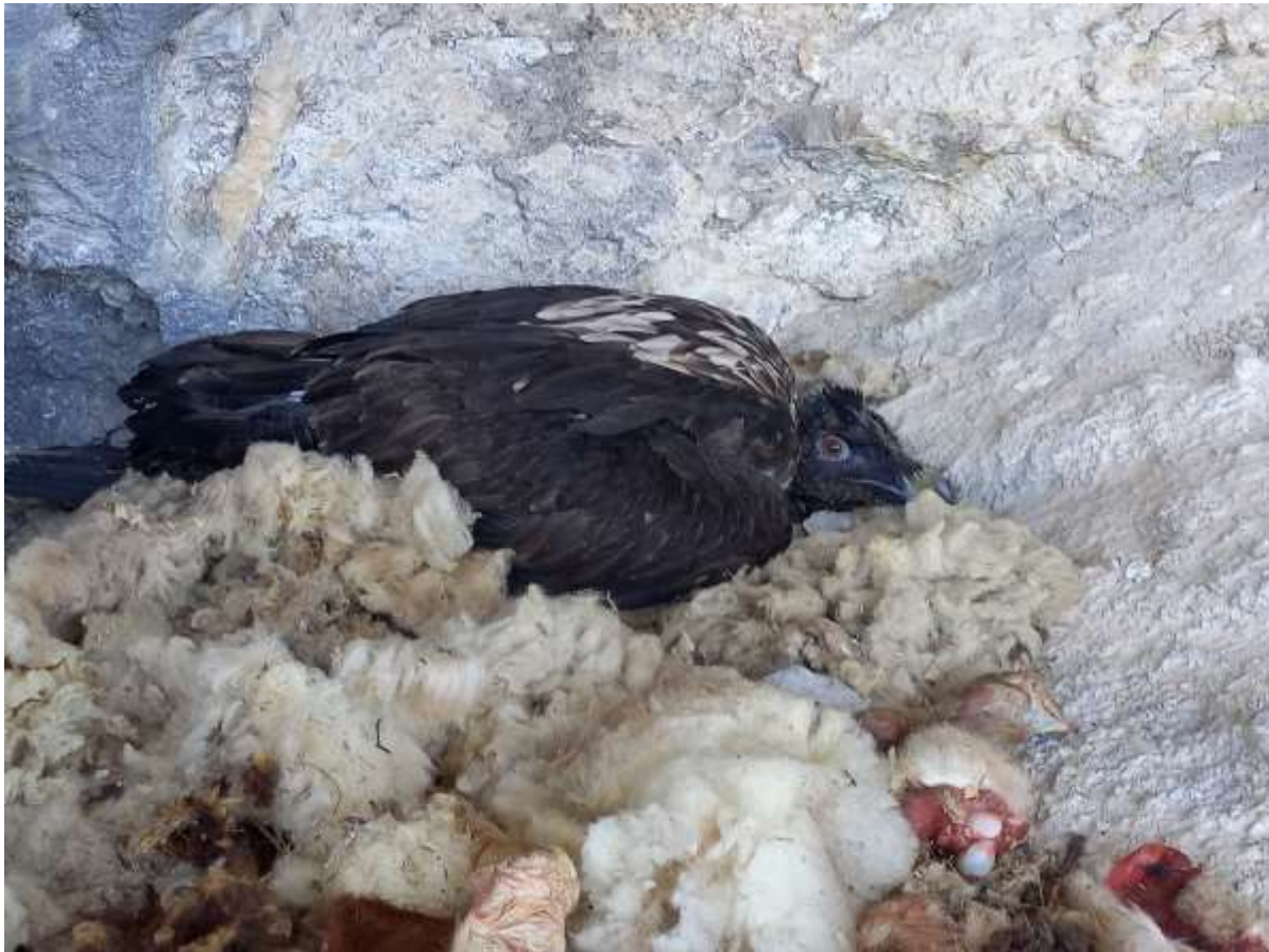
Jeune gypaète sur son site de lâcher

Les réintroductions d'individus issus de captivité se poursuivent dans les Alpes françaises afin de renforcer cette population et d'inciter les gypaètes barbus à transiter entre les Alpes et les Pyrénées notamment via le Massif central afin d'augmenter les échanges d'individus entre ces deux populations. En 2024, les résultats de production de poussins en captivité ayant été très bons, deux individus (Œil Rouge et Meravilha) ont été relâchés dans la Drôme par l'association Vautours en Baronnies et deux autres (Fuego et Boréale) par le Parc naturel régional du Vercors dans le Vercors.