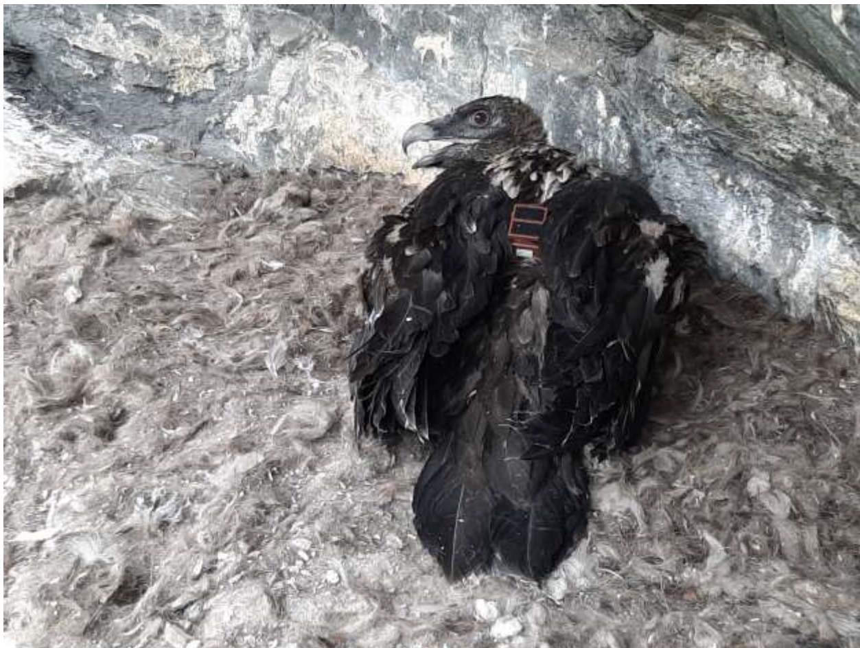
Jeune gypaète au nid équipé de bagues et GPS