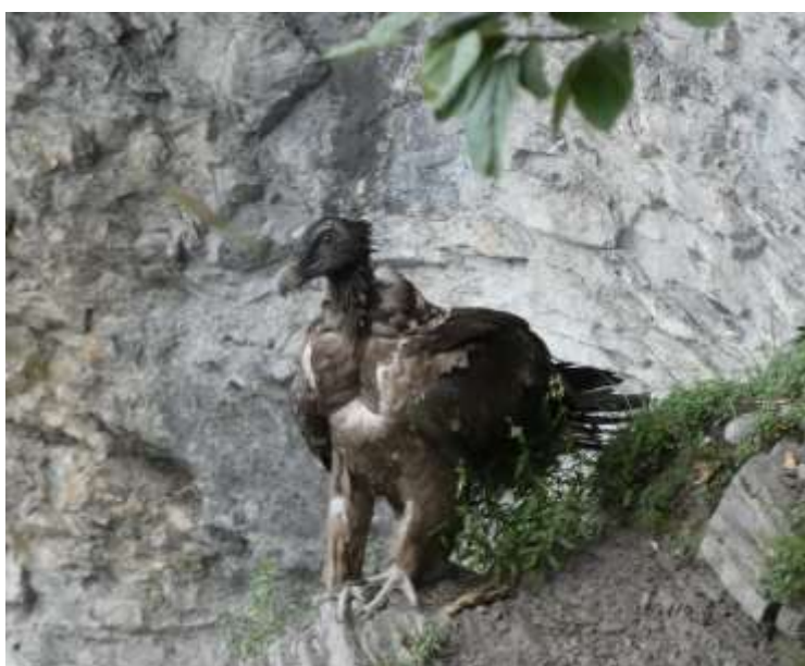
Jeune gypaète posé