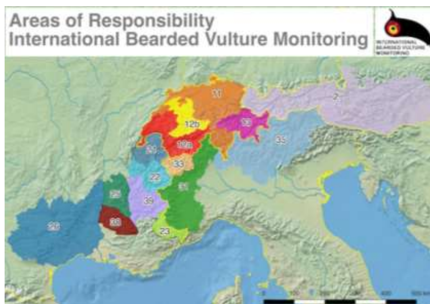
Carte des secteurs IBM sur l'arc alpin