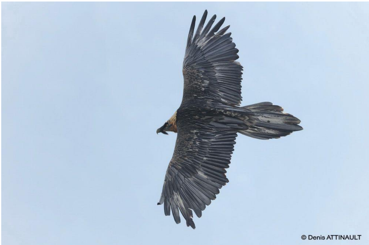
Gypaète adulte imparfait