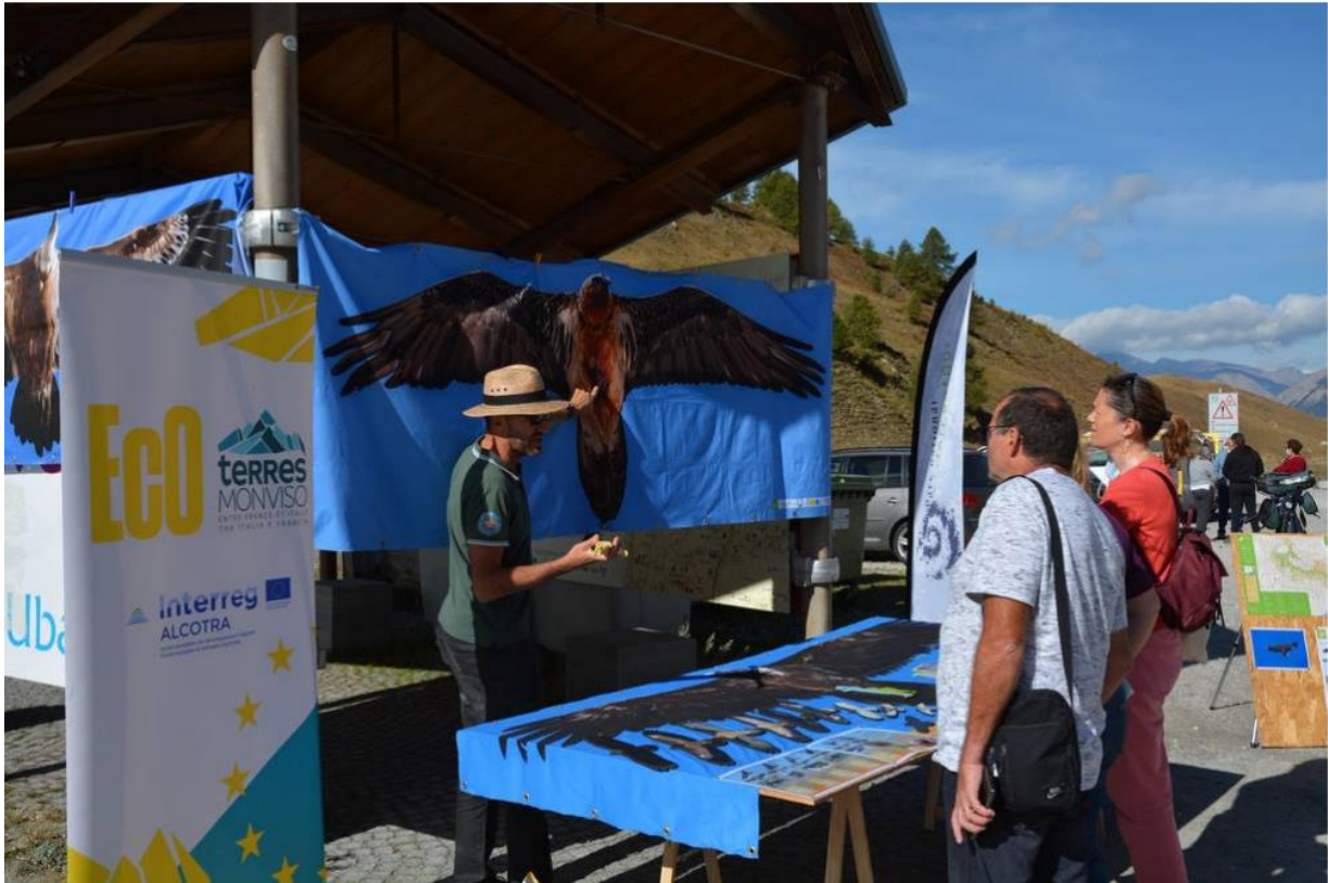
Stand d'information au Col de Larche © H el ene Foulon