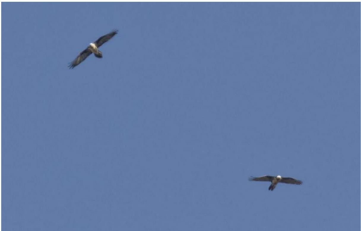
Couple du Val d'Entraunes

Les adultes des quatre couples Chambeyron-Ubayette, Source de l'Ubaye, Val d'Entraunes, et Source de la Tinée ont été observés sur leur site de reproduction. Les adultes du cinquième couple (Bonette) pour ce territoire ont également été vus mais à plus grande distance. Il est possible qu'un adulte en plus ait été contacté dans l'Ubaye.