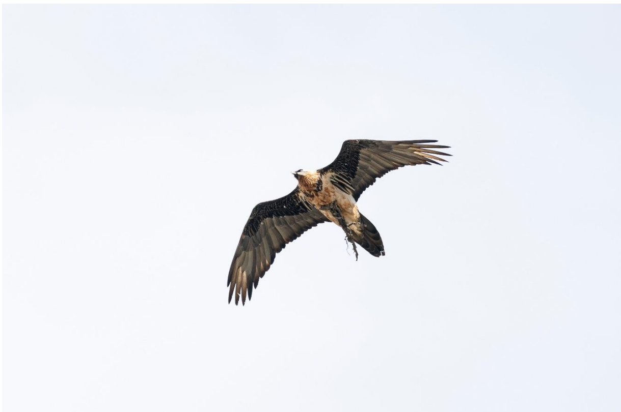
Adulte transportant des matériaux pour la construction du nid

Grâce au suivi de la reproduction des couples réalisé tout au long de l'année, il est possible pour cette classe d'âge d'estimer le nombre d'oiseaux territoriaux qui n'ont pas été comptabilisés ce jour, au minimum 3 individus pour la Haute-Savoie.