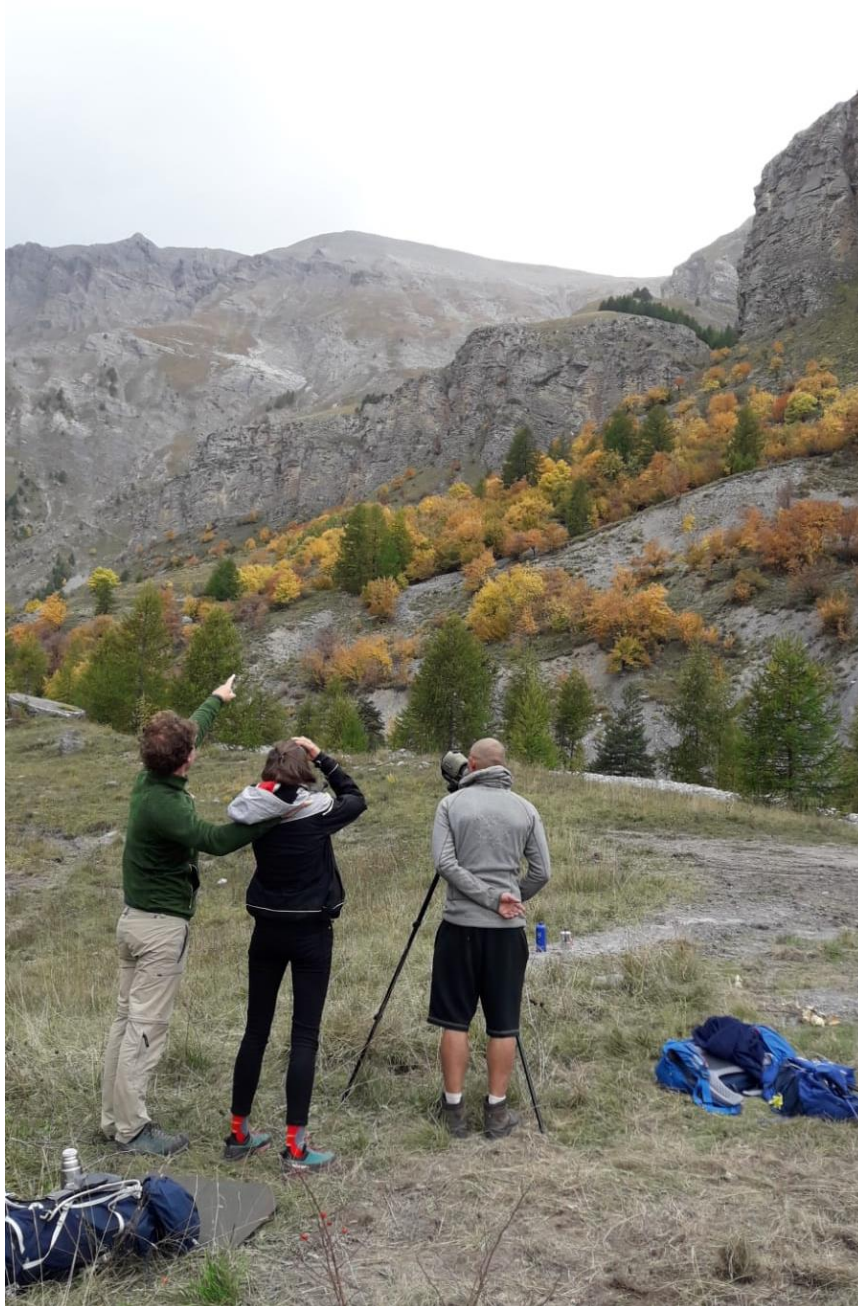
Poste d'observation dans la vallée de la Tinée