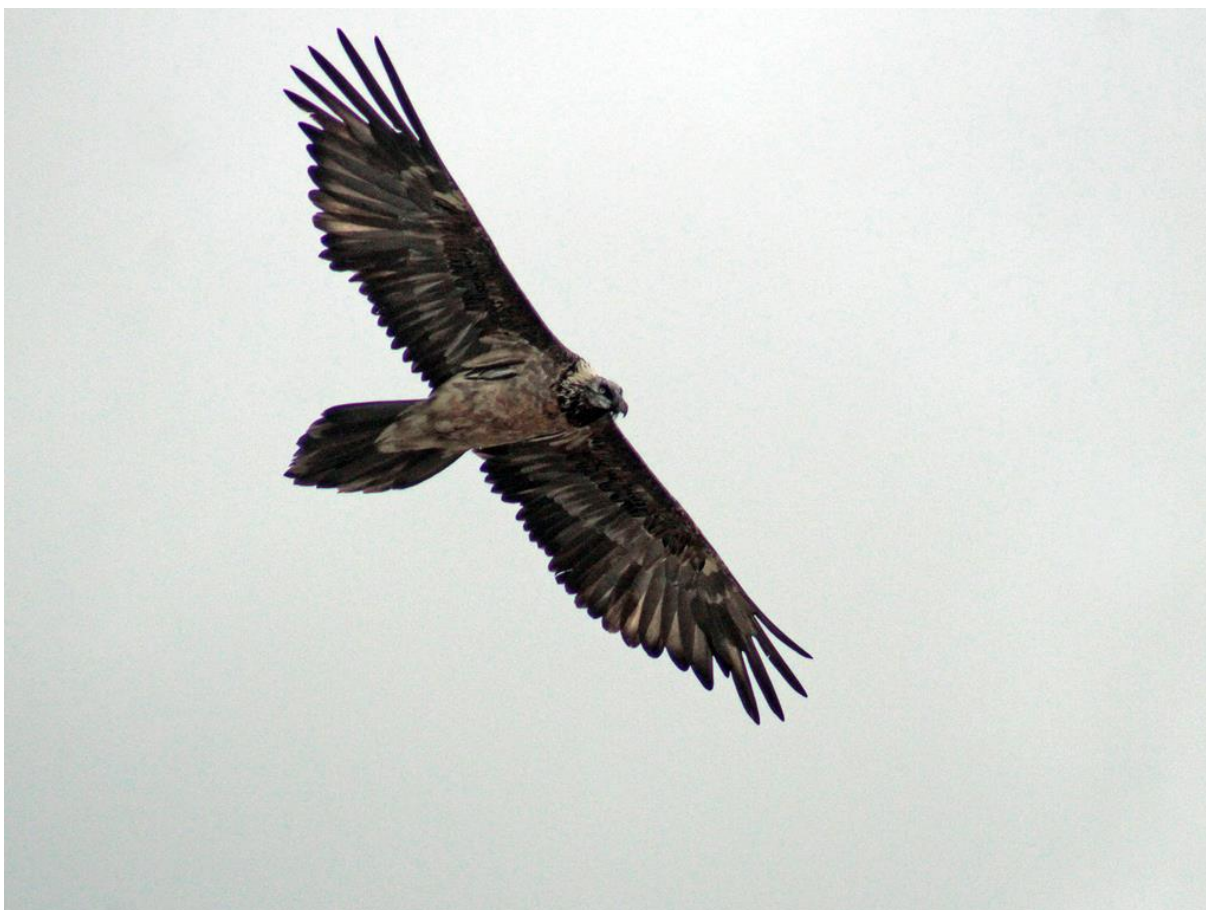
Simay, relâché dans les Baronnies en 2018, observé au-dessus du barrage de Grand-Maison