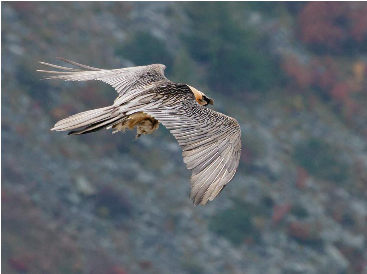
Nonno Bob mâle du couple d'Andagne a été observé avec des matériaux dans les serres à proximité de son site de reproduction

- à Valloire, le couple s'est affairé à recharger le nid (d'où s'est envolé en 2022 un jeune surnommé «Gypipon » par les enfants de l'école).