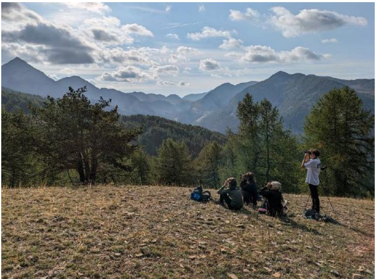
Poste d'observation de la Lance, Haut-Verdon

* Mistral non compté dans le total car déjà comptabilisé avec le Dauphiné, Ecrins.