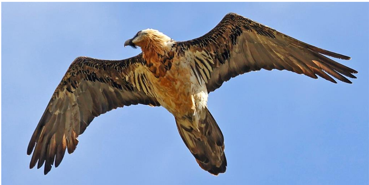
Gypaète adulte au plumage imparfait, troisième adulte du couple de Termignon ?!

Les adultes des couples de Val d'Isère et de Peisey n'ont pas été contactés, et sont rarement vus à proximité de leur nid en tout début de saison.