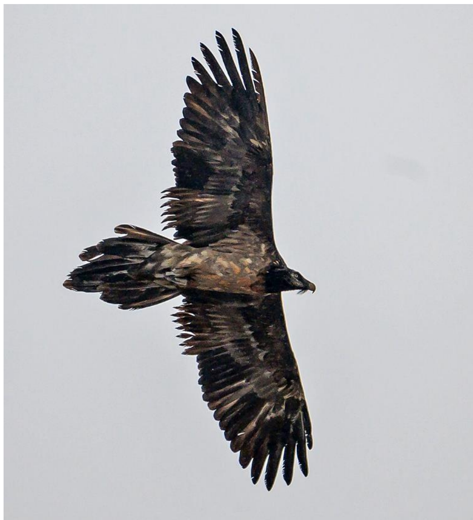
Gypaète immature observé à proximité de Termignon

Les balises GPS indiquent que 5 autres individus immatures ont été présents sur le département au cours de la journée : Vidoc à proximité du barrage de Grand-Maison, Sunny en Maurienne, Prazon près de la Clavettaz à proximité des Chapieux et Dôme au Galibier.