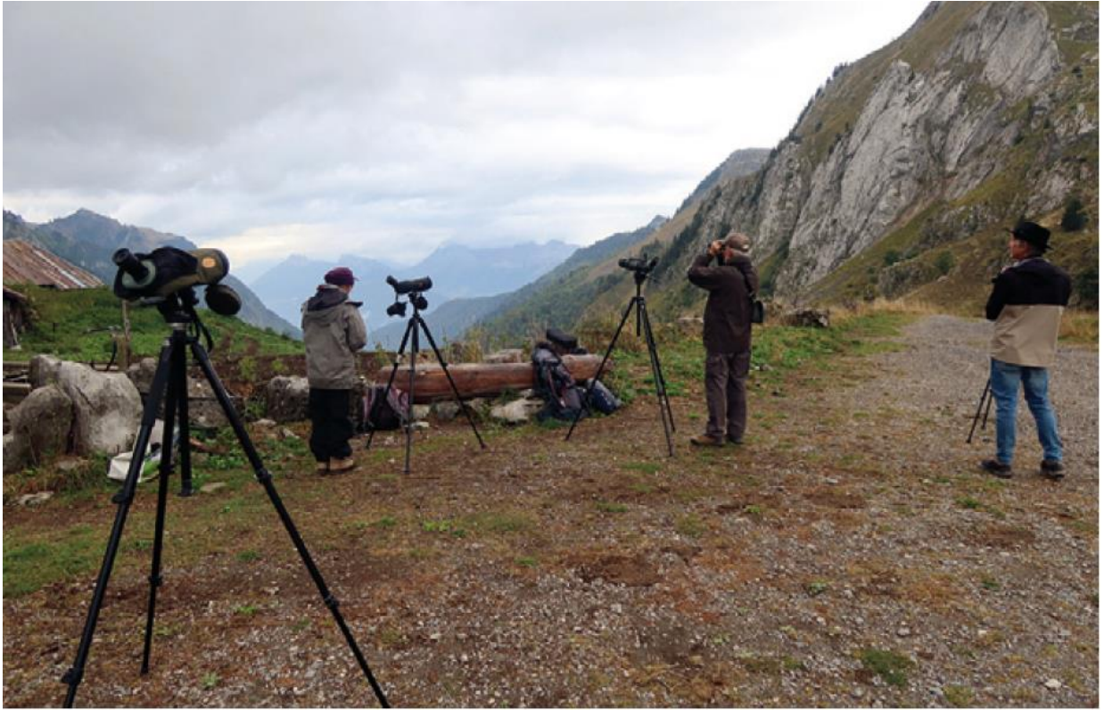
Poste grand public dans le massif des Bauges