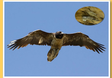
Drumana en juin à Bessans