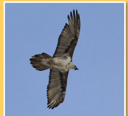
Gypa blanc, vu aux Chapieux en novembre