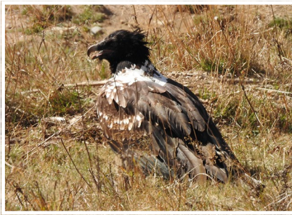
Juvénile au col du Glandon en septembre, peut-être Elvio

Ces individus nés entre 2016 et 2019 ont tous été relâchés dans le cadre du programme Life Gyp'Connect destiné à rétablir les échanges entre les populations alpines réintroduites et les « méridionales » (Pyrénées, Corse, qui n'ont jamais disparu), en passant par le Sud du Massif Central. L'objectif est d'assurer un certain brassage génétique mais aussi de favoriser la recolonisation progressive de l'ensemble des massifs potentiellement favorables. Actuellement, les lâchers concernent les