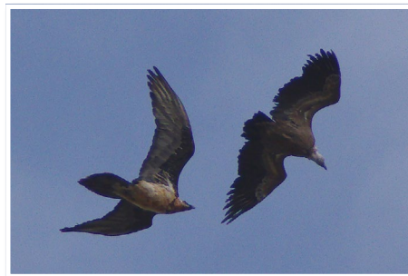
Conflit territorial entre gypaète et vautour fauve à Valloire

● En ce qui concerne les autres catégories d'âges , ont pu être individualisés : 2 subadultes (4-5 ans, dont la tête commence à blanchir) en Haute-Maurienne dont Girun lâché dans les Baronnies en 2016 ; 12 immatures (« tête noire » 2-3 ans avec des rémiges en mue ou de différentes longueurs) dont Simay lâché dans les Baronnies en 2018, observés sur de nombreux secteurs ; 6 juvéniles (en Beaufortain, Haute-Tarentaise et Haute-Maurienne) dont les jeunes : Désiré né cette année à Bessans, et Altitude né à Peisey.