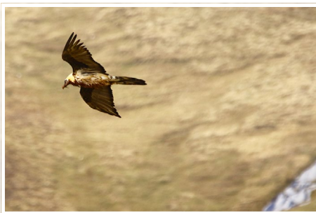
Adulte tout juste coloré au col du Petit-Saint-Bernard

● On a ainsi pu dénombrer au minimum 16 « type adulte » : ont vraisemblablement été contactés sur leurs sites de repro habituels les couples de Peisey (en simultané avec un 3 e adulte sur le 2 nd site), de Val d'Isère, de Termignon, de Bessans, et la femelle du couple de Lanslevillard ; mais également 2 individus au col du Pt St Bernard (où 1 adulte se colore alors que le 2 nd est reconnu sur photo comme régulièrement contacté à Peisey cette année ... situation compliquée, car ni le couple italien voisin ni celui des Chapieux n'ont été contactés aux abords de leur aire) ; 2 adultes à Valloire fréquentant toujours les mêmes parois depuis plusieurs années ; 2 « type adulte » également dans les Encombres ; ainsi qu'1 adulte imparfait au col du Glandon (individu déjà signalé trois fois s'en prenant aux vautours...).