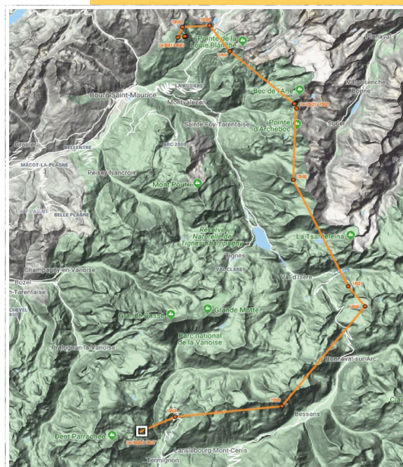
Périple d' Altitude le jour de l'IOD

Trudi contacté en haute-Maurienne en juillet 2018 mais depuis un an, son plumage a dû s'éclaircir, sa tête blanchir (type subadulte)... • Photo © J.-Y. Ployer