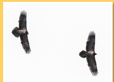
Juvéniles 1 et 3 contactés au Plan de la Cha en Haute-Maurienne