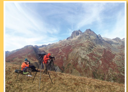
Poste d'observation au col du Glandon