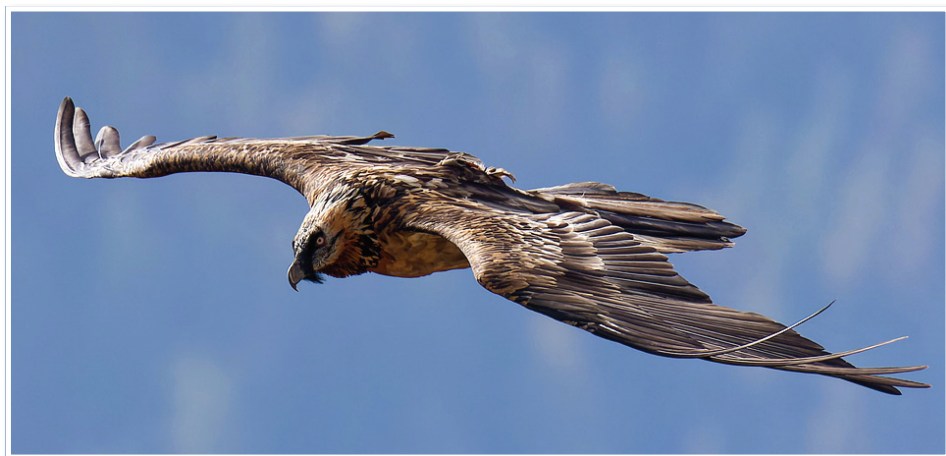
Kobalann est un gypaète subadulte, lâché dans le Vercors en 2020, habitué de la vallée