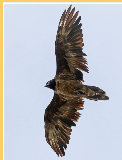
La Haute-Maurienne, cette année encore, ne dément pas sa réputation de réservoir d'immatures