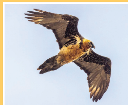
Un voisin en visite à Valloire