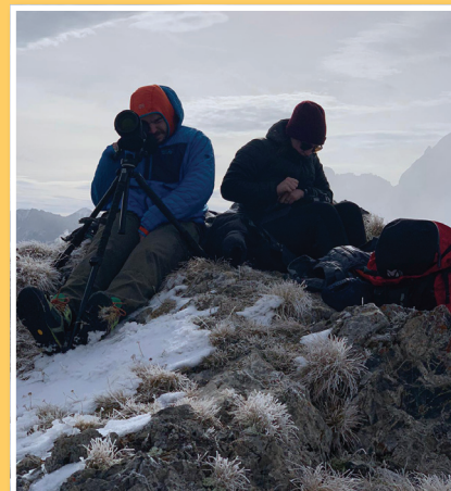
Poste sur le secteur de Valloire • Photo © N. Goin

– Un seul tête noire « en promenade » porté par le vent au col du Petit St Bernard , arrivant d'Italie.