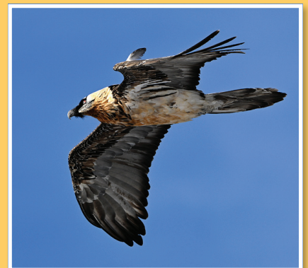
À Pralognan, la photo de Plumie qui lui a valu son surnom

N'hésitez pas à nous demander des précisions si vous avez la possibilité d'assurer des suivis : certains secteurs restent beaucoup moins renseignés que d'autres !