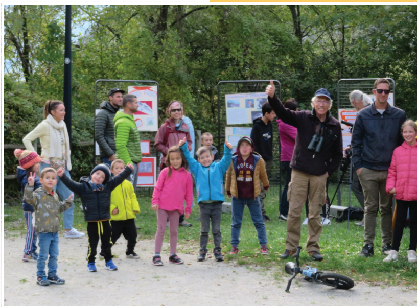
Intérêt marqué de toute l'école de St Julien pour le casseur d'os